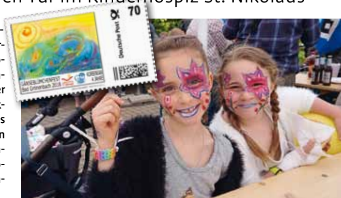
Kinderschminken ist eine der Attraktionen im bunten Festprogramm.

Bad Grönenbach (dl). Am Samstag, 16. Juni, feiert das Kinderhospiz St. Nikolaus in Bad Grönenbach sein Gänseblümchenfest mit einem großen Tag der offenen Tür und vielen Attraktionen. Auch heuer bietet das Organisationsteam wieder ein abwechslungsreiches Familienprogramm mit Tombola, Motorradfahrten, Clowns und Kinderschminken.