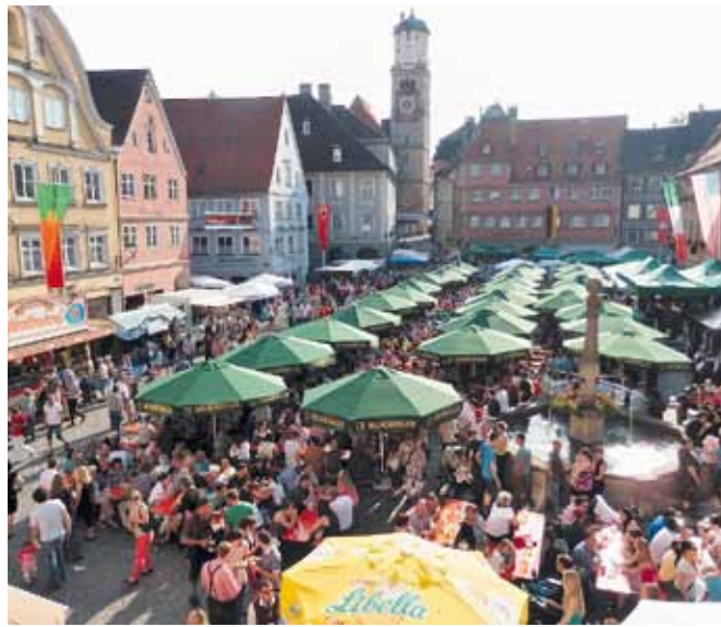
Stets gut besucht ist die „gute Stube“ Memmingsens beim Stadtfest.

Memmingen (dl). Am Samstag, 9. Juni, laden stadtmaking und Stadt Memmingen wieder zum Shoppen und Feiern nach Memmingen ein. Das stadtmaking bedankt sich mit dem 47. Stadtfest auf dem Marktplatz bei allen Kunden für ihre Treue zur Einkaufsstadt Memmingen.