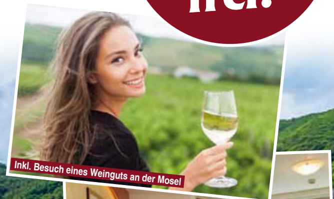
Inkl. Besuch eines Weinguts an der Mosel