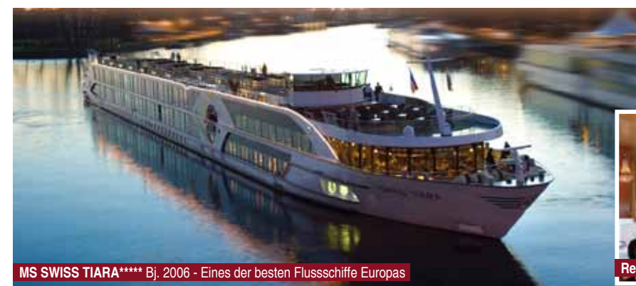
MS SWISS TIARA***** Bj. 2006 - Eines der besten Flussschiffe Europas

6. Tag: Straßburg - Heimreise Ihre exklusive Kreuzfahrt endet heute in der europäischen Hauptstadt Straßburg. Gelegenheit zur Teilnahme an einer Stadtführung (AP). Am Nachmittag Heimreise.