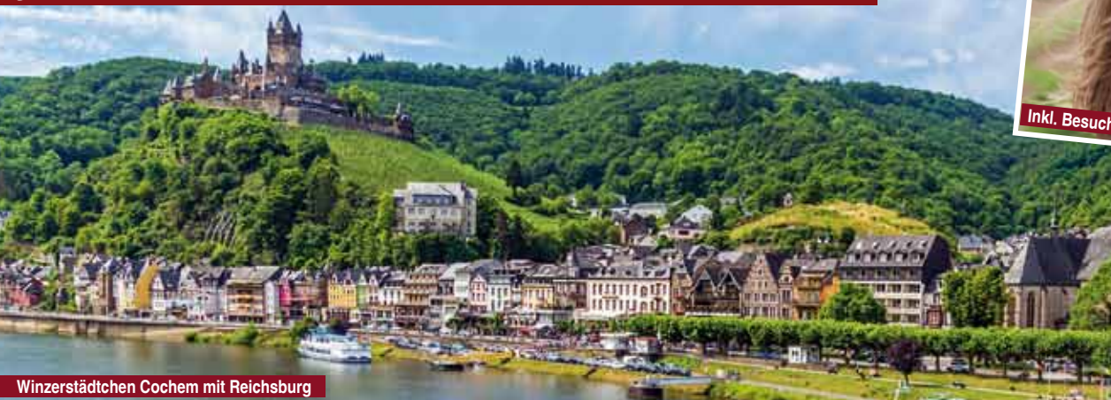
Winzerstädtchen Cochem mit Reichsburg