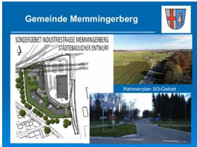
Die Grafik zeigt das Sondergebiet Industriestraße.

„Wir haben unsere Gemeinde zum Positiven weiter entwickelt“, so Lichtensteiger. Notwendige Tiefbausanierungen und weitere