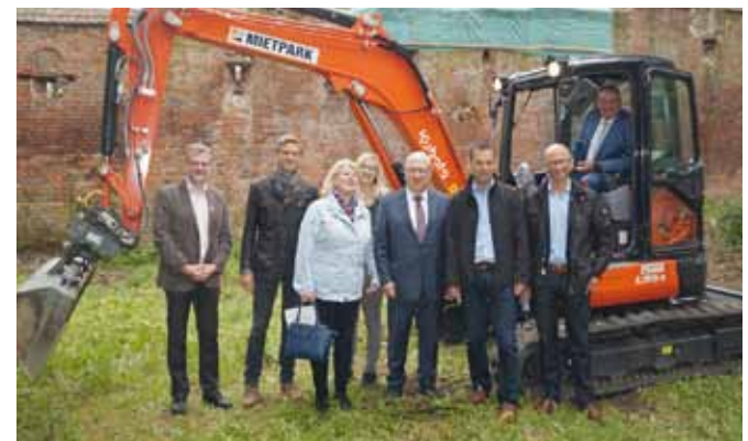
Mit dem ersten Baggerbiss gibt Oberbürgermeister Manfred Schilder den Startschuss für die umfassende Sanierung der historischen Stadtmauer.

Als ehemals freie Reichsstadt verfüge Memmingen noch heute über bedeutende Teile der Stadtmauer aus dem 14. und 15. Jahrhundert, einige Teile stammten gar aus dem zwölften Jahrhundert. Die Mauer erstreckte sich über rund zwei Kilometer. „Fünf Stadttore, sechs Mauertürme und drei Turmruinen gehören dazu“, zählte Schilder auf.