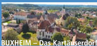
BUXHEIM – Das Kartäuserdorf

Gemeinde Buxheim Kirchplatz 2 87740 Buxheim Tel. 08331 9770-0 Fax: 08331 9770-70 info@buxheim.de www.buxheim.de