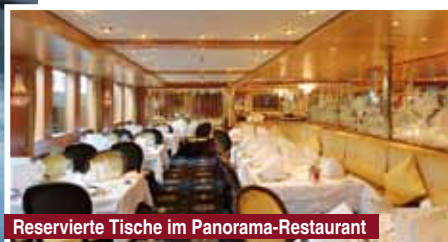
Reservierte Tische im Panorama-Restaurant

Evtl. anfallende Eintrittskosten sind im Reisepreis nicht enthalten und vor Ort zu bezahlen. Preisangaben pro Person inkl. MwSt.. Verfügbarkeit unter Vorbehalt. Mit Erhalt der schriftlichen Reisebestätigung wird eine Anzahlung von 15% fällig, der Restbetrag ist bis 3 Wochen vor Reiseantritt zu zahlen. Es gelten die Geschäftsbedingungen des Veranstalters „Komm mit“ Morent GmbH & Co. OHG, Sigisshofen 29, 87527 Sonthofen-Ofterschwang.