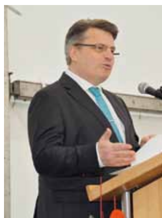
Bayerns Justizminister Professor Dr. Winfried Bausback.

rats, Klaus Holetschek, sagte: „Die Baumaßnahmen erfüllen nicht nur rein technische oder funktionale Zwecke, sondern tragen natürlich auch wesentlich zur Verbesserung des Arbeitsalltags für die insgesamt 46 Bediensteten der JVA bei.“