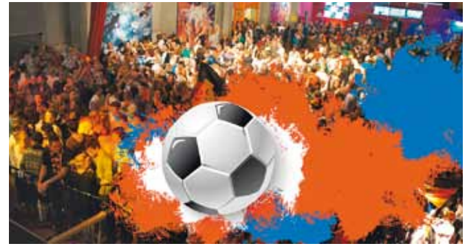
Das Kaminwerk zeigt alle Spiele der deutschen Mannschaft und das Finale.

Memmingen (dl). Wie schon in den letzten Jahren ist das Memminger Kulturzentrum wieder ganz vorne mit dabei, wenn es um Stadionatmosphäre beim Public Viewing geht. Gezeigt werden alle Spiele der deutschen Mannschaft und das Finale.