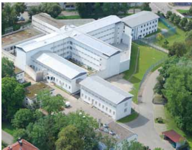
Die sanierte und erweiterte JVA, aus der Luft betrachtet.

Memmingen (jow/rad). Die Justizvollzugsanstalt (JVA) Memmingen ist fit für die Zukunft. Über 16 Millionen Euro wurden dafür investiert, nun wurde der Abschluss der über 20 Jahre langen Baumaßnahmen gefeiert.