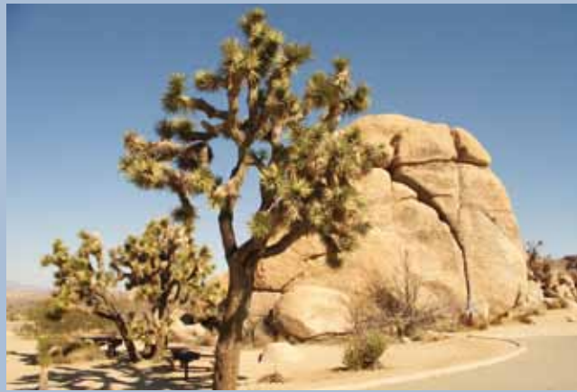
Der Joshua Tree National Park in Kalifornien.

Auch für die jungen Besucher sind die Parks ein spannendes Urlaubsvergnügen. Zumeist werden kostenlose Arbeitsblätter und Aktivitäten angeboten, um den Park interaktiv zu erkunden. Beispielsweise gibt es im Lassen Volcanic National Park eine Aktivitätsbroschüre, in der die heißen Quellen und Vul-