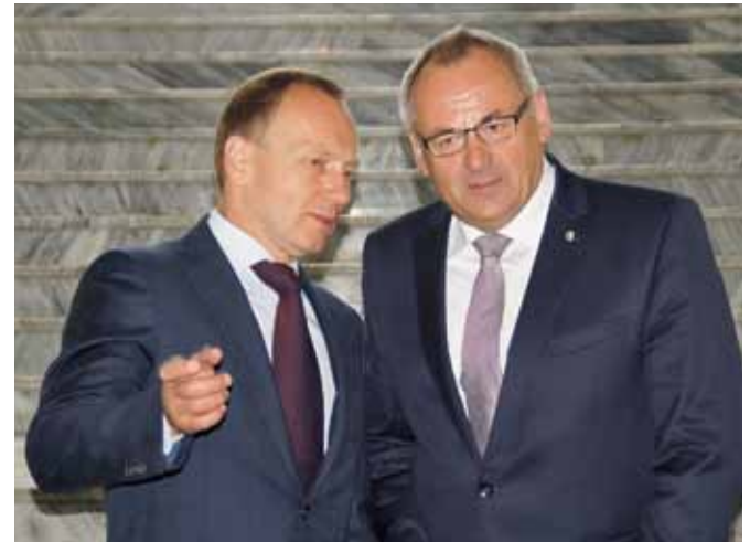
Oberbürgermeister Manfred Schilder mit seinem ukrainischen Amtskollegen Wladyslaw Atroschenko.

Beide Rathauschefs unterstrichen bei ihren Reden die Sinnlosigkeit der kriegerischen Auseinandersetzungen und forderten eine friedliche, diplomatische Lösung. Die Ukraine befindet sich bekanntlich im Konflikt mit Russland, allein in die-